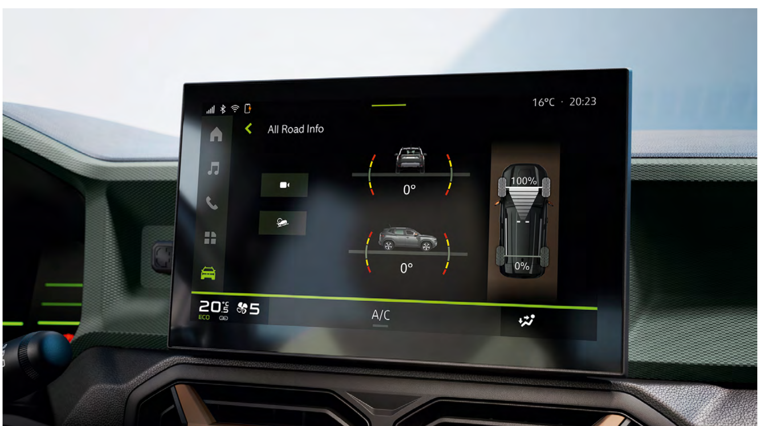
Touchscreen mit Höhenmesser

Im neuen Dacia Duster mit Allradantrieb kann Sie nichts aufhalten: Seine per Drehregler wählbaren Fahrmodi bringen Sie unter allen Bedingungen sicher weiter. Seine Bodenfreiheit von bis zu 217 mm und ein Böschungswinkel von bis zu 31° machen ihn extrem geländegängig. Dank Allradantrieb meistern Sie auch schwieriges Terrain, Bauteile aus kratzfestem Starkle® schützen dabei wichtige Karosserieteile.